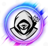
HACKERHOOD COLLETTIVO DI HACKER ETICI DI REDHOTCYBER